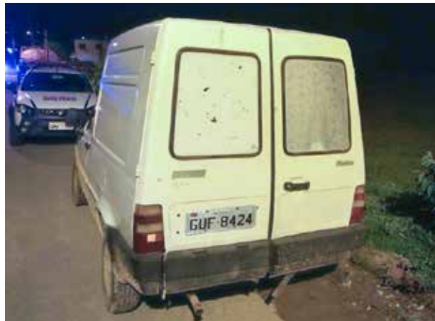
O veículo foi furtado em Viçosa

A Polícia Militar de Muriaé localizou por volta das 20 horas de quarta-feira, 4, o automóvel Fiat/Fiorino branco, placa GUL-9261, tarjeta de Viçosa, que havia sido furtado por volta das 10 horas da manhã de domingo, 1º, na rua dos Estudantes, centro de Viçosa. Os militares chegaram até o veículo furtado depois