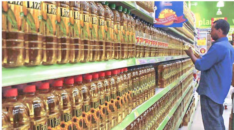
Em outubro, cesta básica ficou R$ 0,47 mais cara

Viçosa voltou a registrar inflação pelo quinto mês consecutivo, conforme o boletim do IPC – Viçosa (Índice de Preços ao Consumidor), divulgado nessa terça-feira, 10. No mês de outubro, Viçosa teve inflação de 1,10%, índice menor do que o registrado em setembro (1,45%).