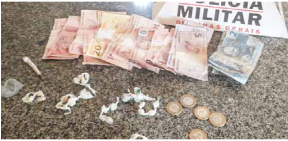
Drogas e dinheiro apreendidos pelos militares no João Mariano

Os policiais foram até o local, onde abordaram o menor e com ele apreenderam R$ 190, dois papéletes de cocaína, uma bucha e um cigarro de maconha. Próximo ao local onde ele foi abordado os policiais encontraram ainda 24 pedras de crack. A polícia informou que o menor assumiu a propriedade das drogas e afirmou vendê-las naquele local. Ele foi detido e encaminhado para a Delegacia de Polícia, juntamente com as drogas apreendidas.