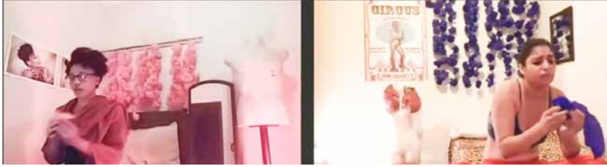
O grupo viçosense Casa da Mãe Jeane apresentou o espetáculo “Abre a janela”

Quinta-feira – 12 de novembro de 2020 - Folha da Mata - 14