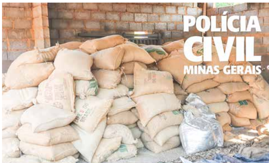
A carga de café roubada foi localizada em Ubá

formações da vítima, os criminosos seguiram até o trevo de Piraúba, onde ordenaram que ele tirasse o rastreador do veículo e entrasse no carro que era conduzido por outros integrantes da quadrilha.