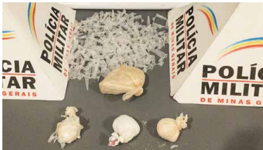
Porções de drogas e embalagens apreendidas pela polícia

Policiais militares receberam informações de que um morador da rua Alice Moreira Pinheiro, no bairro Bom Jesus, em Viçosa, estava comercializando drogas e por volta das 15 horas de sábado, 7, foram até o local, onde, durante buscas em um terreno, apreenderam uma pedra avantajada de crack, três porções de cocaína e diversos pinos vazios, comumente usados para acondicionar drogas. Os materiais foram apreendidos e encaminhados para a Delegacia de Polícia. Nenhum criminoso foi encontrado.