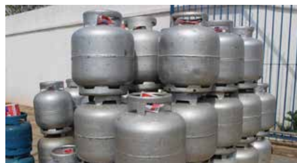
Média de preços registrada em Viçosa é maior que a projeção nacional

O Folha da Mata, nessa terça-feira, 10, realizou uma pesquisa de preço em Viçosa e constatou que o preço subiu em dez distribuidoras de botijão de gás. Antes do reajuste, os viçosenses podiam encontrar o produto por R$ 65 (mínimo). Agora, o menor