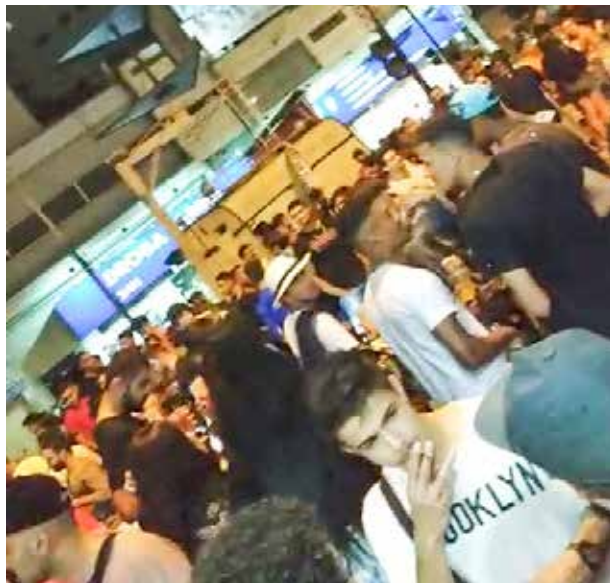
Situações como esta, tirando o sossego dos moradores, são registradas mesmo em tempos de pandemia

Já o Saae de Viçosa (Serviço Autônomo de Água e Esgoto) ressaltou que a responsabilidade da limpeza na região dos bares é dos proprietários,