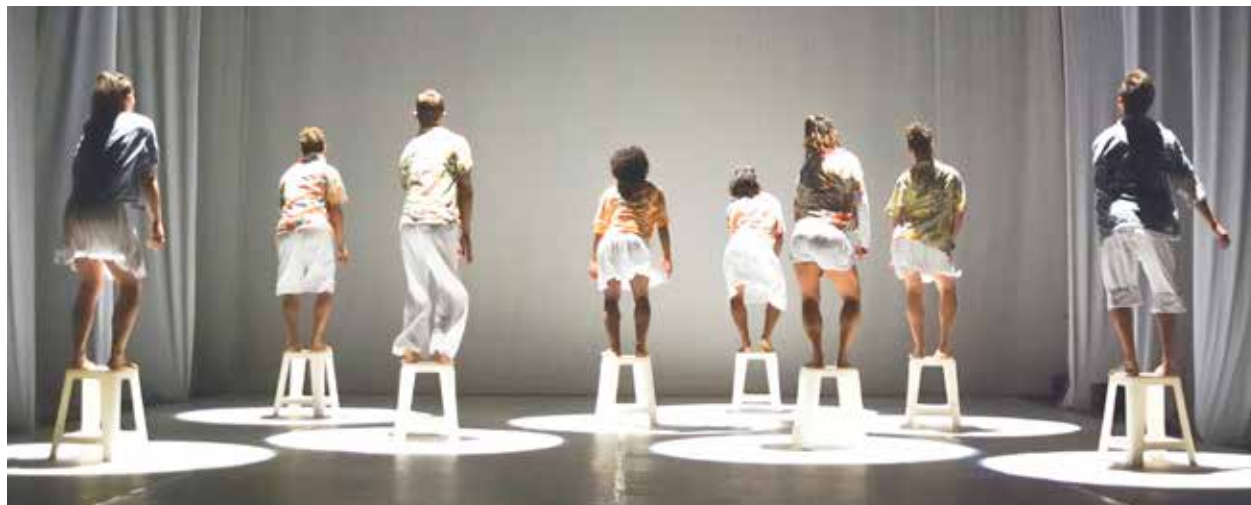
O evento abordará as potencialidades da Dança Contemporânea